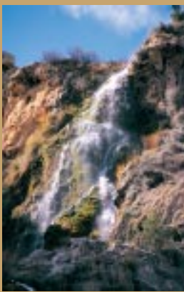
Chorro de San Juan