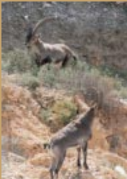
Cabras montesas en libertad